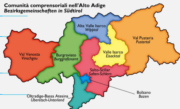
Comunità comprensoriali nell'Alto Adige Bezirksgemeinschaften in Südtirol